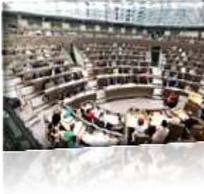
Vlaams Parlement (Brussel)