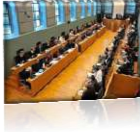
Waals Parlement (Namen)